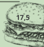
Plate kipsaté 17,5

Plate met varkensschnitzel, rauwkost, friet en champignon-roomsaus.